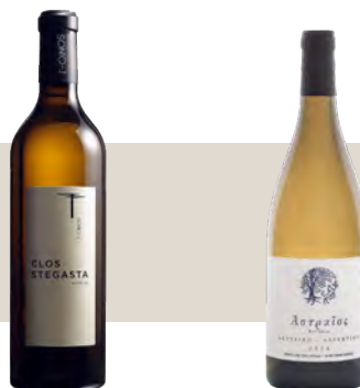
T-Oinos Winery Clos Stegasta Τήνος

Υψηλή Οξύτητα Ορυκτότητα, μεταλλικότητα Αίσθηση αρμύρας Εσπεριδοειδή, πυρηνόκαρπα λευκά λουλούδια