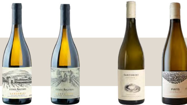
Κτήμα Αργυρού Cuvée Palatia Σαντορίνη

Υψηλή Οξύτητα Ορυκτότητα, μεταλλικότητα Αίσθηση αρμύρας Εσπεριδοειδή, πυρηνόκαρπα λευκά λουλούδια, ζύμη