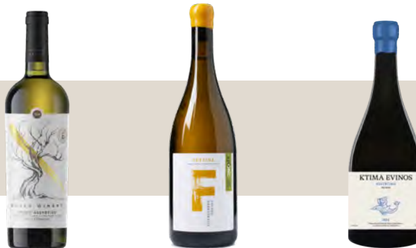
Κτήμα Μουσών Crispy Assyrtiko Π.Γ.Ε. Θήβα

Υψηλή Οξύτητα Ορυκτότητα Μελωμένα φρούτα εσπεριδοειδή και πυρηνόκαρπα